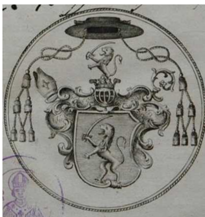
Sélyei Nagy Ignác püspöki címere