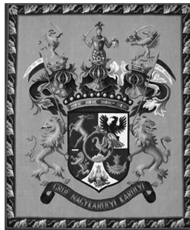
Gr. Károlyi család címere